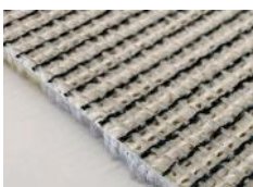
Fondo estructurado en moqueta.